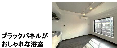
ブラックパネルが おしゃれな浴室