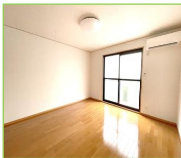
★シャブードレッサー