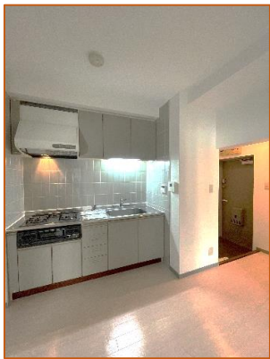
7.32帖の広々ダイニング