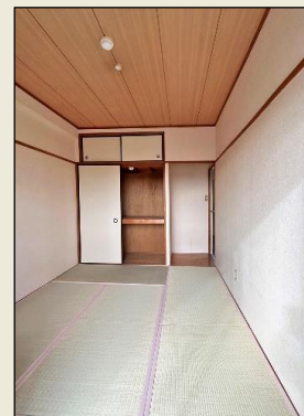
南向きの心地よい和室

バス情報 本物件前に「夢見ヶ崎動物公園」停留所あり 「川崎駅西口」まで市営バス22分、臨港バス23分 「新川崎交通広場」まで臨港バス・東急バス5分