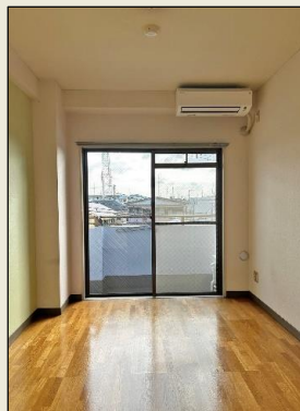
洋室に新規エアコンあり