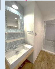
オシャレな パウダールーム