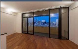
*建物屋上からの眺望(普段は施設) 2024年7月隅田川花火大会にて