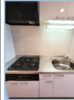
グリル付き3口コンロの システムキッチン

面積: 30.18m 2 間取: 1K 賃料: 85,000円 共益費: 10,000円 自治会費(月額): 200円 現況: 補修中