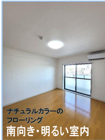
ナチュラルカラーの フローリング 南向き・明るい室内