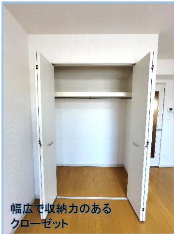
幅広で収納力のある クローゼット