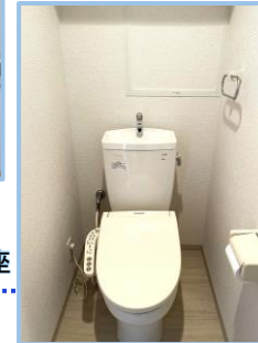
シャワー付 温水洗浄便座