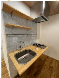
オシャレなキッチン