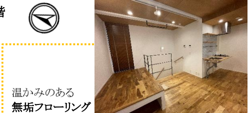
温かみのある無垢フローリング