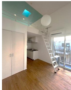
おしゃれなアクセントクロス & 広々ロフト付き