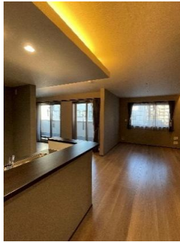
※写真は同タイプ別部屋です。