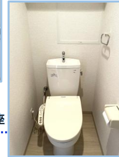
シャワー付 温水洗浄便座