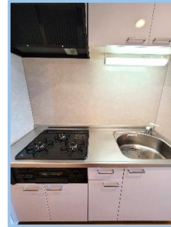
グリル付き3口コンロのシステムキッチン

面積: 30.18m 2 間取: 1K 賃料: 86,000円 共益費: 10,000円 自治会費(月額): 200円 現況: 3/29解約予定