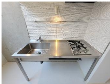
無骨なデザインが特徴の 2口ガスコンロキッチン