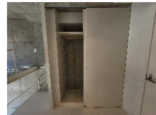
ホワイトでまとめられた 明るい水回り