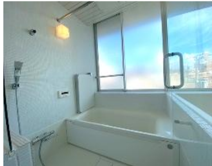
白を基調とした 清潔感のある浴室

【間取】1LDK 【面積】50.14㎡ 【賃料】145,000円 【共益費】10,000円 【現況】6/11解約予定