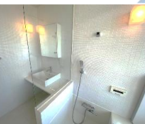
設備・建具など すべて白で統一