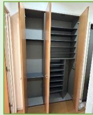
約13.7帖のリビング 明るい室内