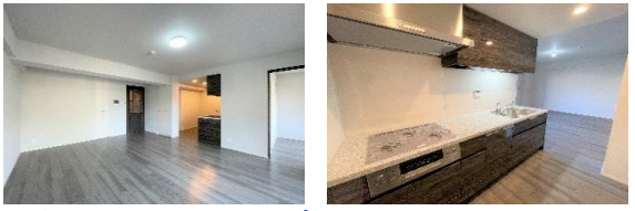
奥行のある バルコニー ワイングラス ホルダー付収納 食器洗浄乾燥機